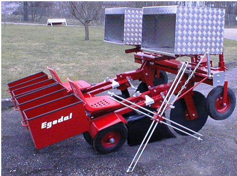
Caisse standard pour plants – distanceur à sonnette (croix)