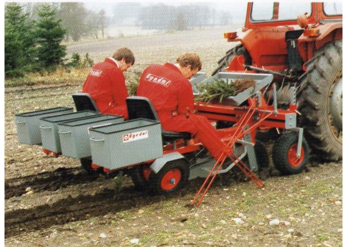
siège dos à la marche