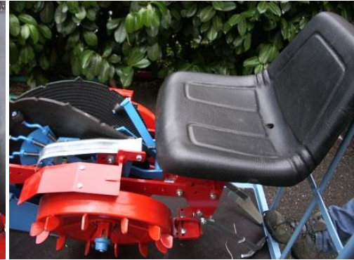
Détail siège confort réglable