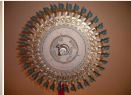
Roue 36 pinces