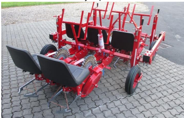
Planteuse MT – 5 rangs (3+2)

La roue à disques caoutchouc est polyvalente et convient bien aux exploitations maraichères qui cultivent une large palette de légumes. Elle peut recevoir des bulbes, des plants en racine nue et en mini mottes jusqu'à 4x4cm