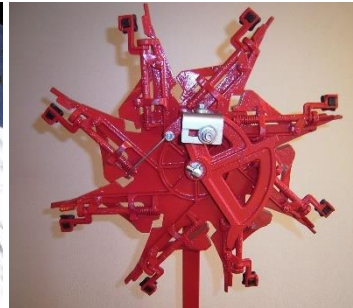
Roue 8 pinces