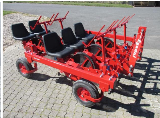
avec disques caoutchouc

Toutes modifications réservées – données et photos non contractuelles