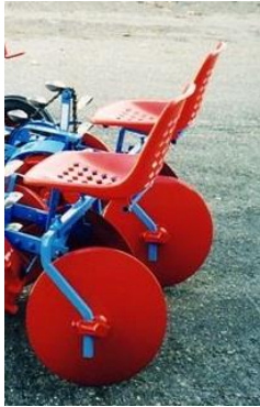
Disque de buttage Ø 350mm