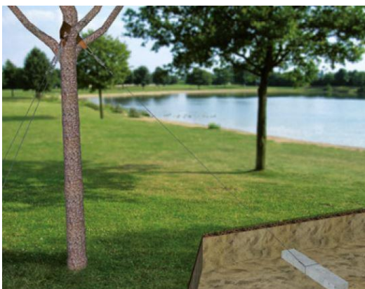
Ancrage sur plot