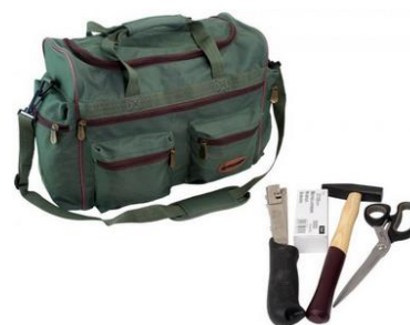
Trousse à outils

Désignation Agrafeuse marteau 4-6mm Agrafes 6mm, paquet de 5000 unités Ciseau à revêtement titane