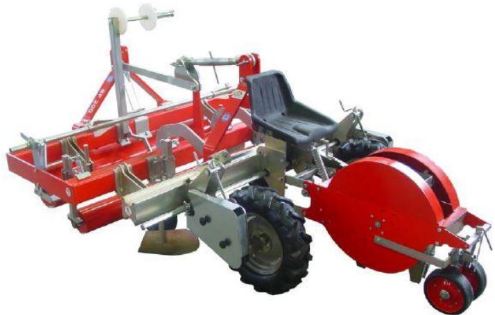
Combiné dérouleuse planteuse