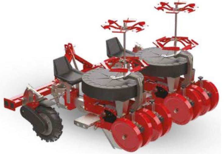
Modèle TB24 – 2 modules – 4 rangs