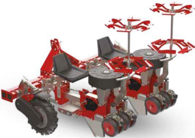
Modèle TB12 – 2 modules – 4 rangs