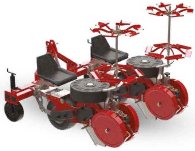
Opérateurs assis dos à la marche pour sol léger type TCM-A