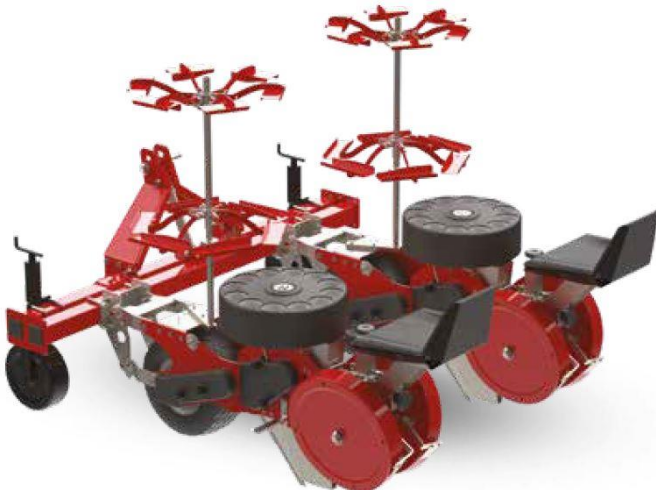
Opérateurs assis dans le sens de la marche pour sol lourd type TCM