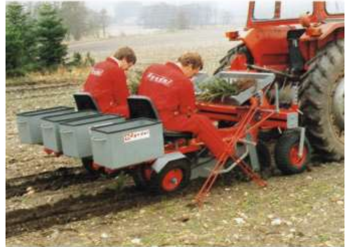
JT siège standard