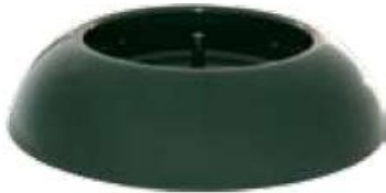
Classic vert Réf.: MS94200106

Les « Etoiles » de décoration sont autocollantes et jointes au colis pour une personnalisation individuelle.