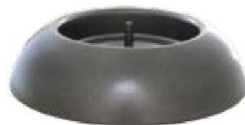
Classic anthracite MS94200108