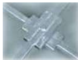
Détail de charnière