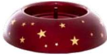
Classic rouge MS94200107