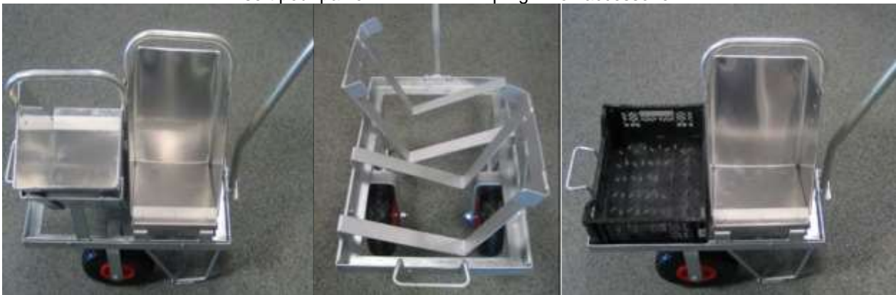
Insert Panier récolte asperge réf. ME102020

Insert pour panier de récolte d'asperge – en accessoire