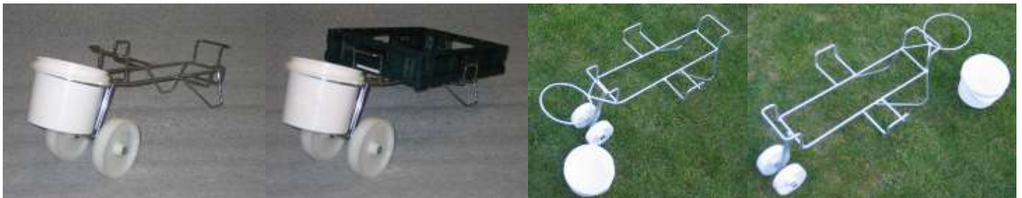
Réf. ME100202 Réf. ME1002 seau devant