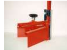
Soc de buttage