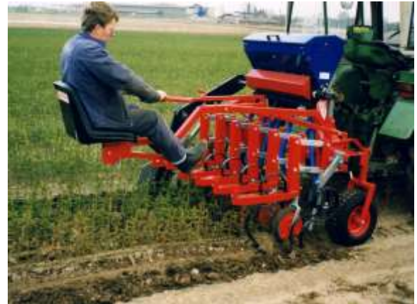
GS avec fertiliseur