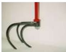
Griffe à 3 dents

En option: Supports A, fertiliseur, unité de désherbage, dents à 3 griffes, socs de buttage, socs spéciaux.