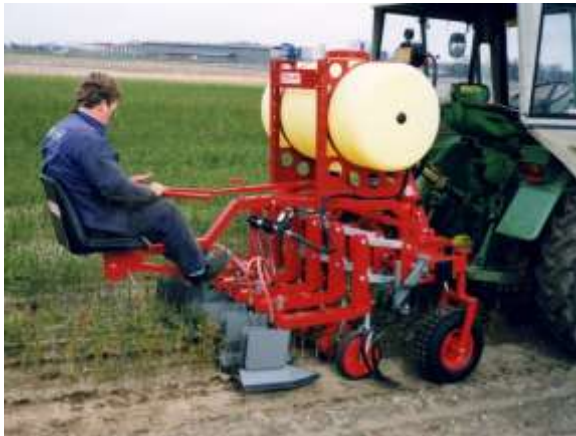
GS avec l'unité de désherbage

Pépinières – Horticulture - Espaces Verts – Paysage – Maraichage – Viticulture – Arboriculture - ETFA